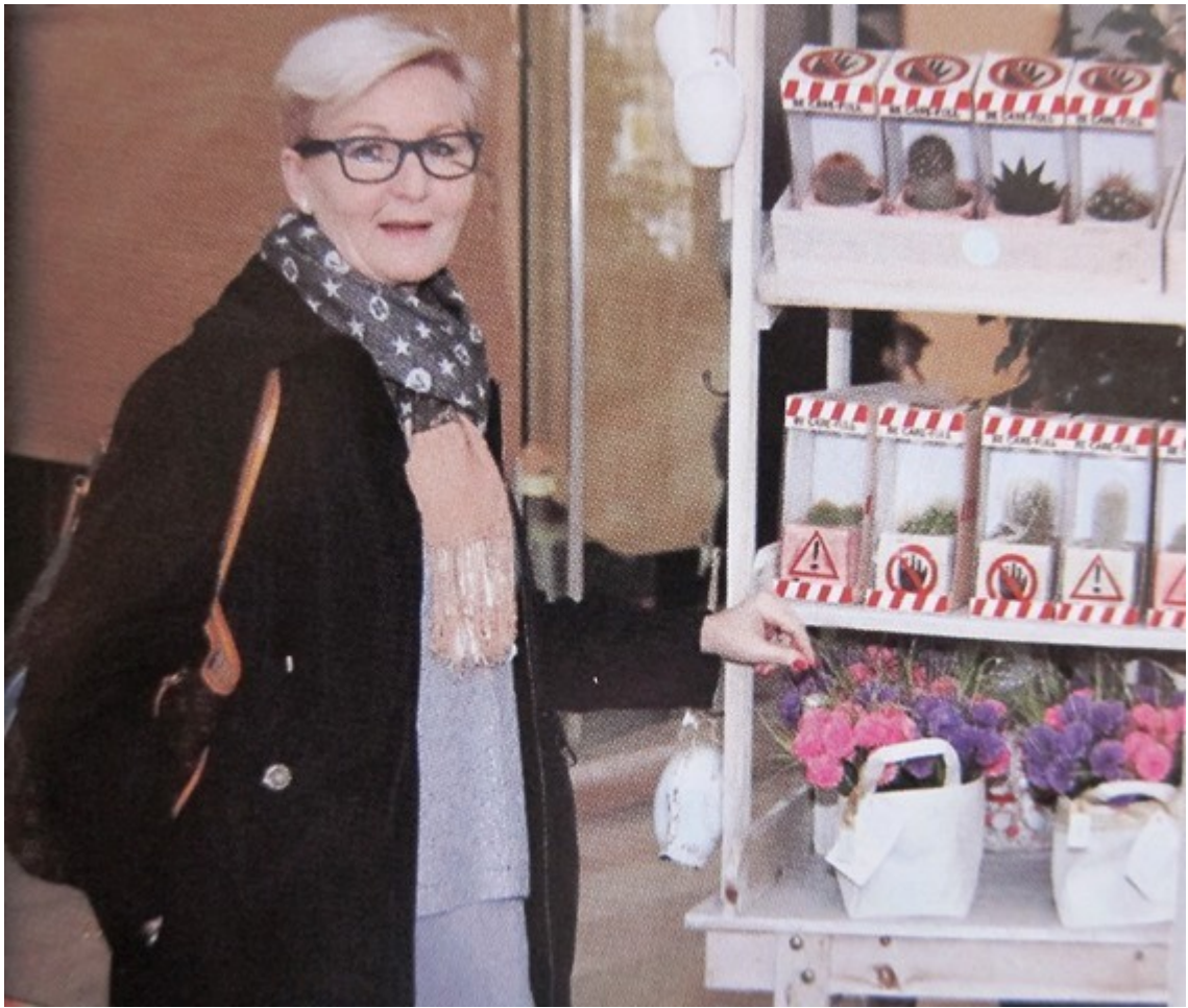
Texto: Bellido