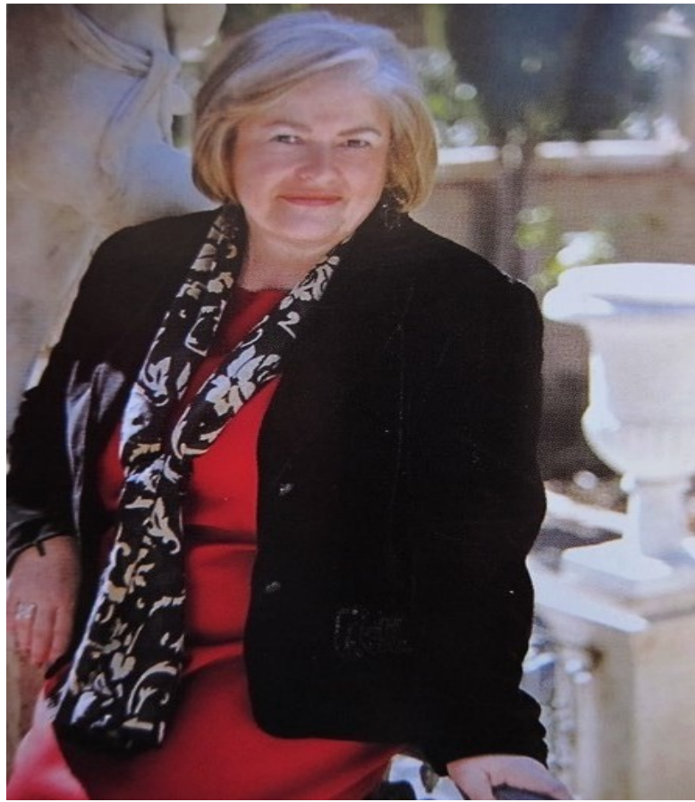
TEXTO: Amparo Martín Moret Periodista-FMIV